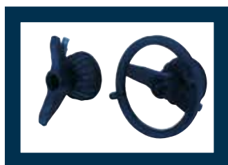
Serie coni con ghiera rapida Set of cones with quick locking handle Set de cônes avec bride rapide Konenset mit Schnellspannflansch Juego de conos con brida rápida